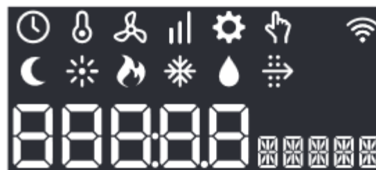
Alle iconen en karakters in het scherm.

Links de WtW-unit (met in het midden onderaan het display op de unit) en rechts het display, uitvergroot met de knopjes en hun functie.